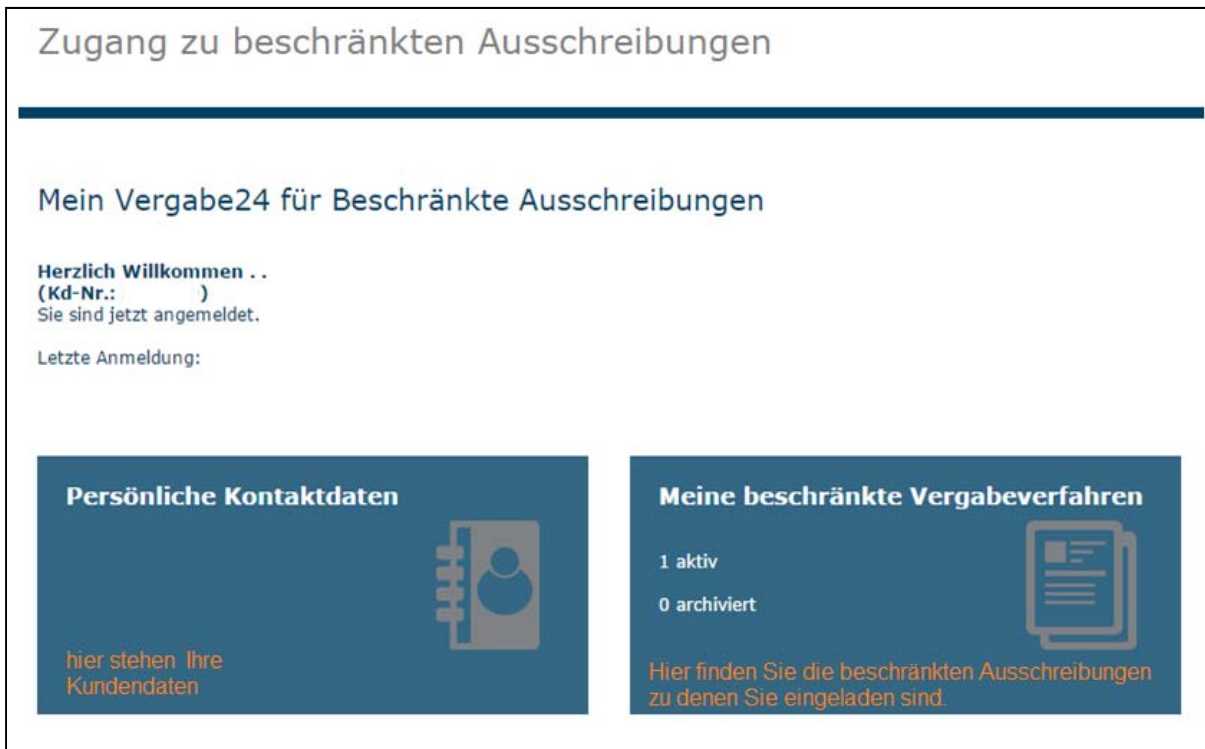
Bild: Ansicht nach erfolgreicher Anmeldung

8.) Ansicht nach der erfolgreichen Anmeldung mit Ihrem neu vergeben Passwort.